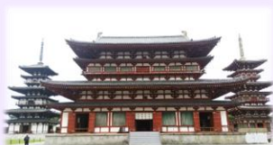
奈良 西の京 薬師寺