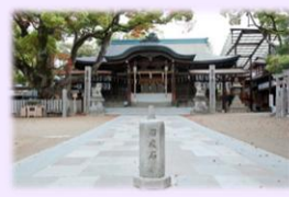
東大阪 石切劔箭神社