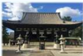
加古川 鶴林寺本堂