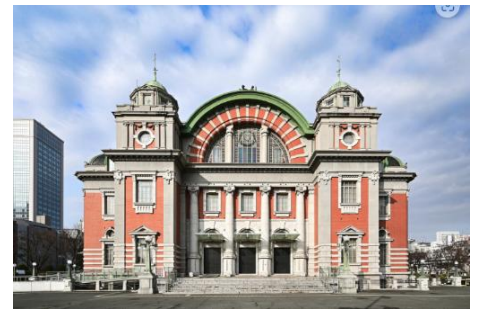
大阪市中央公会堂