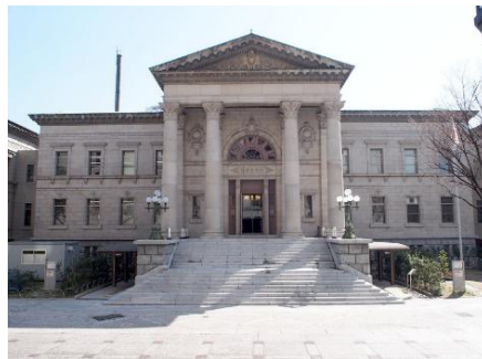
府立中之島図書館