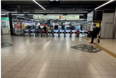
写真は JR 鶴橋駅から近鉄鶴橋駅へ入った処です