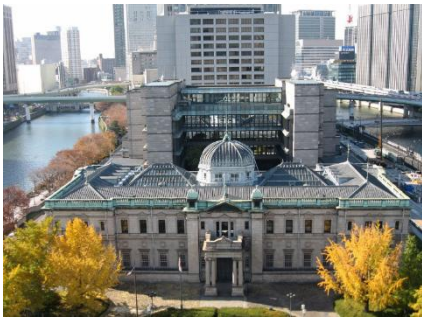
日本銀行大阪支店