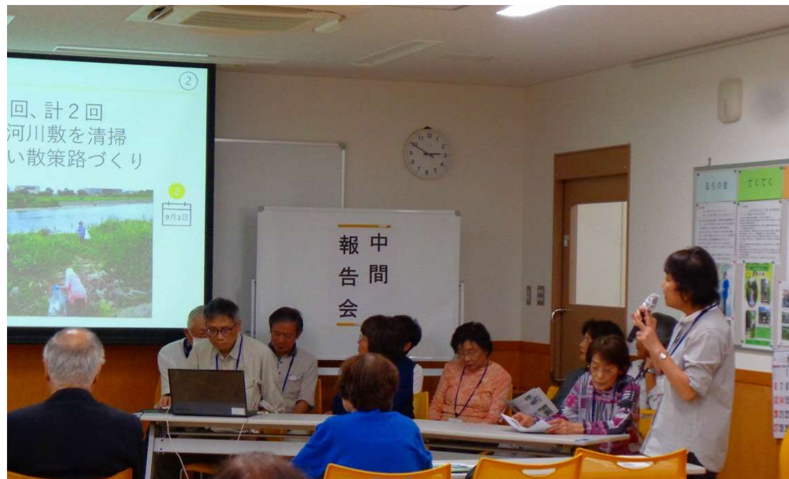
中間報告会の発表