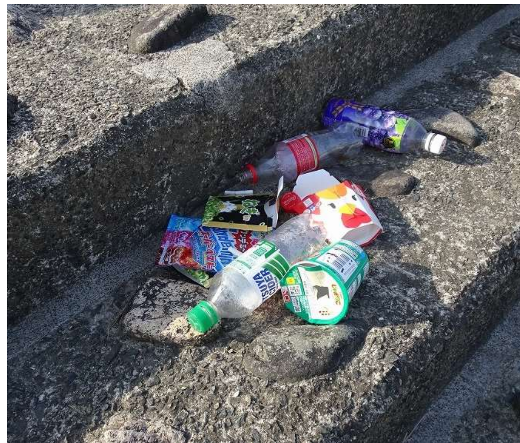
始末する意識が 感じられない