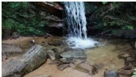
高座の滝 ロックガーデン入口