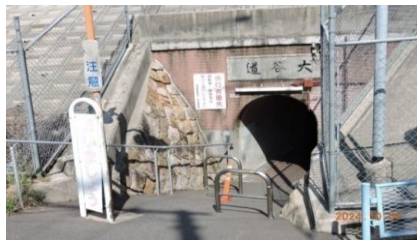
大谷道(まんぼうトンネル)