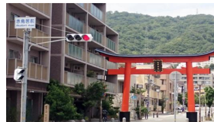
朱鳥居前 ゴールまでもうすぐです。