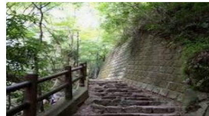
芦屋川から高座の滝までは上り坂です。