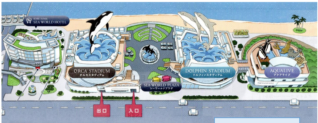
神戸須磨シーワールド