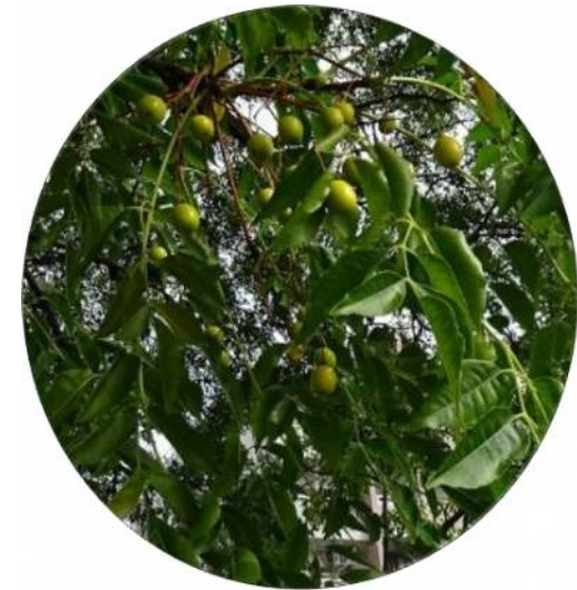
前回授業で習った ムクロジの実