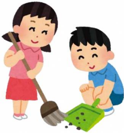
道具を常備して地域で清掃