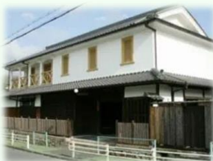
三田 旧九鬼家資料館