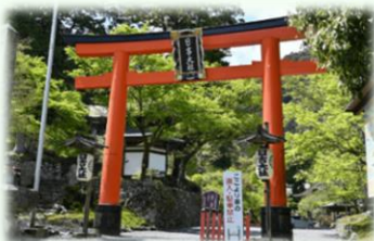
比叡山坂本 日吉大社