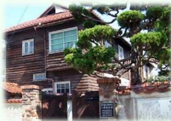
近江八幡 ヴォーリス記念館