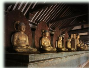
浄瑠璃寺 九体阿弥陀如来像