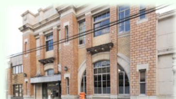
龍野 うすくち醤油記念館